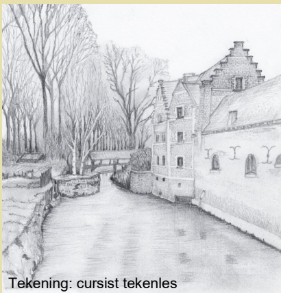
Tekening: cursist tekenles

Opgelet! Cursussen zijn enkel voor Android toestellen.